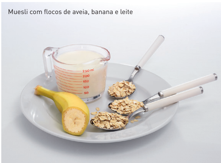
Muesli com flocos de aveia, banana e leite